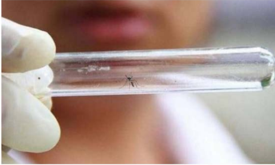
البعوض المسبب لفيروس زيكا - أرشيفية

وتظل فترة الحضانة للفيروس غير واضحة، لكنها تمتد على الأرجح لعدة أيام، وتشبه أعراضه أعراض العدوى بالفيروسات الأخرى المنقولة بالمفصليات، وتشمل الحمى والطفح الجلدي والتهاب الملتحمة والألم العضلي وآلام المفاصل والتوعك والصداع، وعادة ما تكون هذه الأعراض خفيفة.