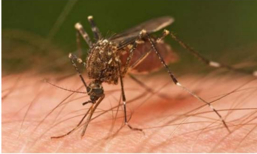
الناموس وراء نقل فيروس "زيكا"

ويشكو المصابون بالفيروس من الحمى الخفيفة والطفح الجلدي، وعادة تستمر هذه الأعراض لمدة تتراوح بين يومين إلى 7 أيام. وتقول منظمة الصحة العالمية إنه حتى الآن لا يوجد علاج محدد لهذا المرض أو لقاح مضاد له، بينما تتمثل أفضل طريقة للوقاية منه في الحماية من لسع البعوض، مضيفة أنه يسري في إفريقيا والأمريكتين وآسيا والمحيط الهادئ. وتعرف المنظمة فيروس زيكا بأنه مستجد ينقله البعوض، وقد اكتُشف لأول مرة في أوغندا في عام 1947 في قرود الريص بواسطة شبكة رصد الحمى الصفراء الحرجية، ثم اكتُشف بعد ذلك في البشر في عام 1952 في أوغندا وتانزانيا.