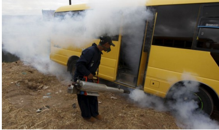
رش لمنع انتشار البعوض الناقل للعدوى فيروس زیکا

بتصريح منظمة الصحة العالمية حول انتشار فيروس "زیکا" بشكل فائق السرعة، ودعوات الرئيس الأمريكي باراك أوباما للتصدي للفيروس ومطالبته بسرعة تطوير الاختبارات واللقاحات وعلاجات الفيروس، انتشرت المخاوف حول انتقال الفيروس الجديد حول العالم