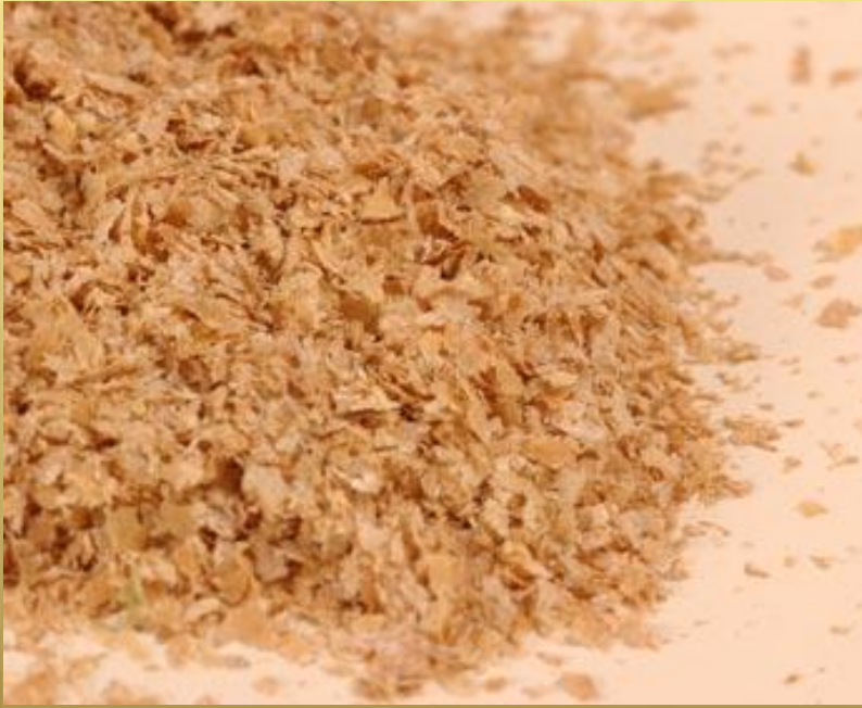
نخالة القمح الخشنة