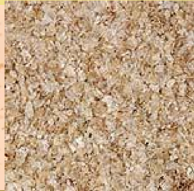
نخالة القمح الناعمة