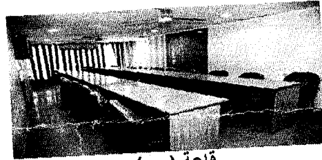
قاعة ( ب )