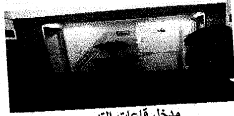
مدخل قاعات التدريب