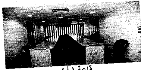
قاعة ( أ )