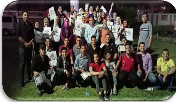
ملتقى اعداد القادة الأول