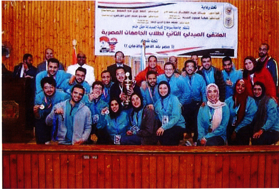
مشاركة الكلية في الملتقى الصيدلي الثاني لكليات الصيدلة على مستوى الجمهورية من 1/26 إلى 1/30