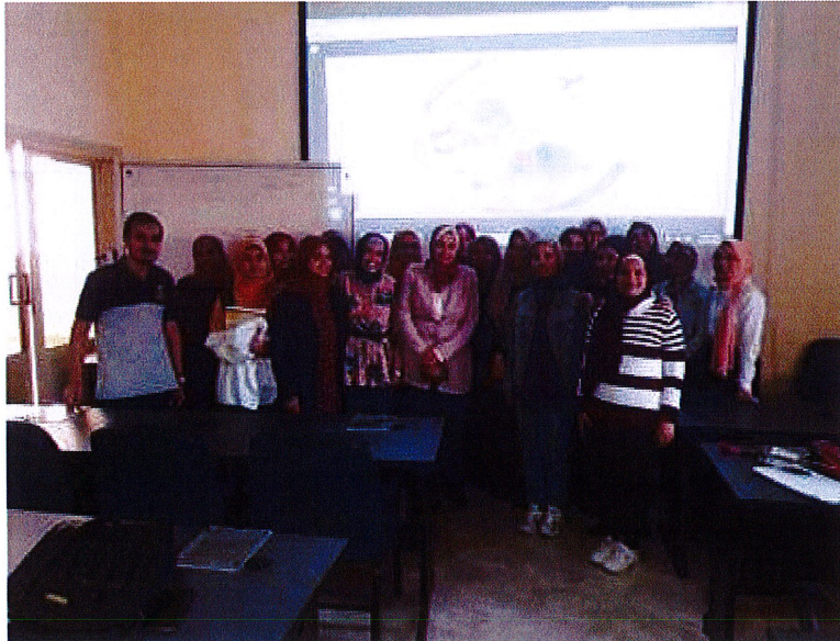
مشاركة ادارة الكلية الطلاب فى احدى فاعليات نادى المجلة