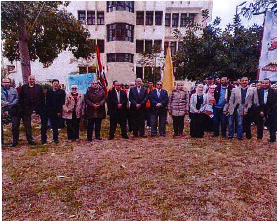
تنظيم الكلية مهرجان كلية الصيدلة الأول للأسر الطلابية على مستوى كليات الجامعة من 2/10 إلى 2/12