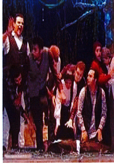
مشاركة الكلية في المهرجان المسرحي على مستوى الجامعة بالعرض المسرحي " مهاجر بريسبان " يوم 12/5