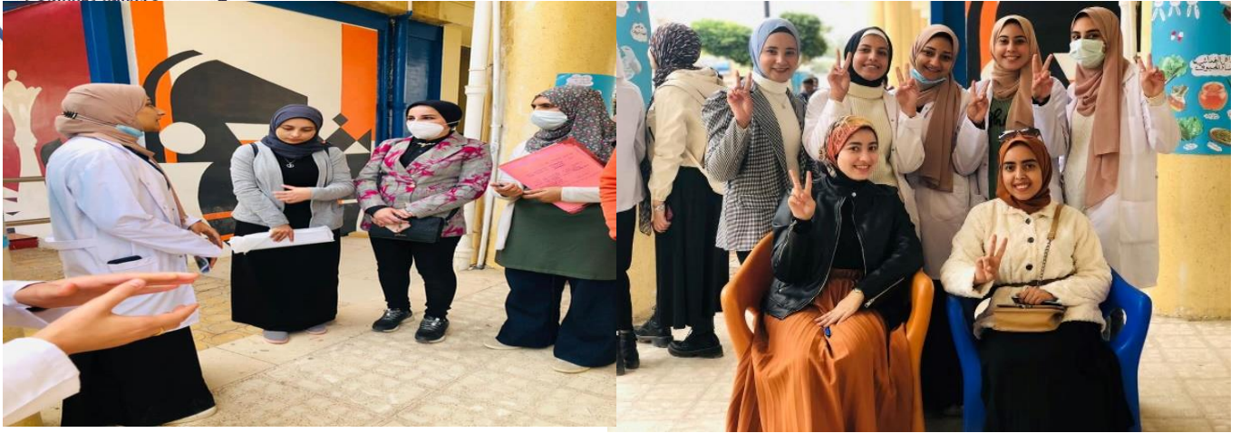
الحصول على المركز الأول في مسابقة دورى المعلومات والتي تنظمها إدارة الأسر الطلابية أيام الإثنين والثلاثاء والأربعاء ٧، ٨، ١٢/٢٠٢١م.