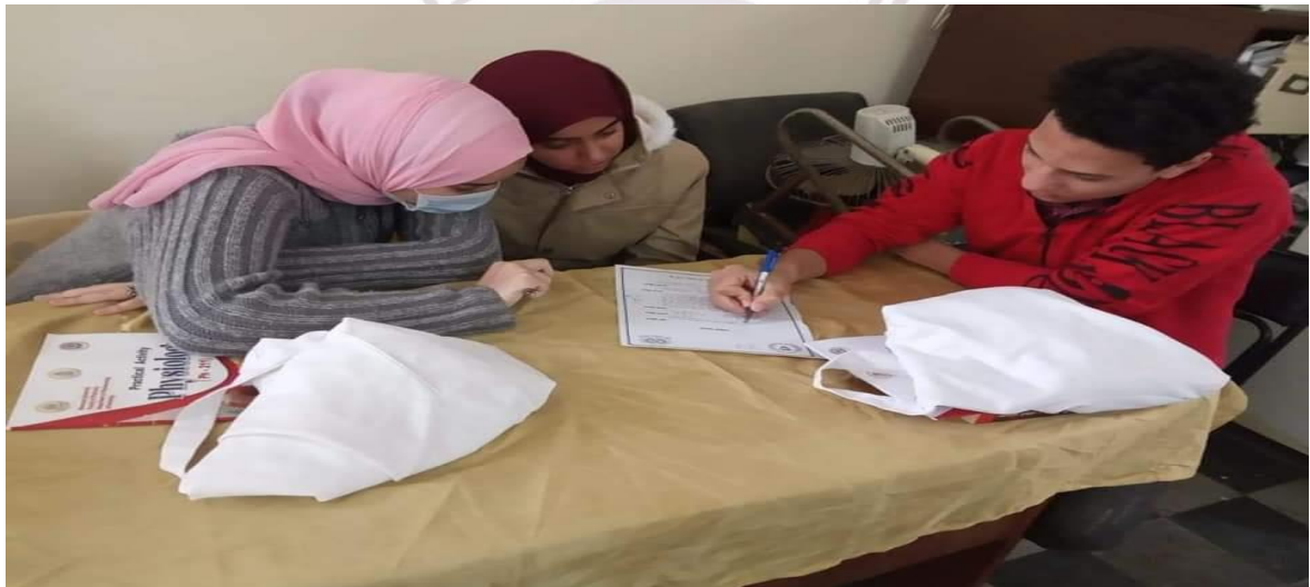
مجلس إتحاد طلاب الكلية للعام الجامعى ٢٠٢١/٢٠٢٢م