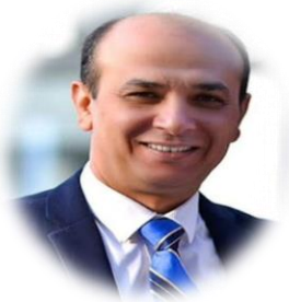
الأستاذ الدكتور / طارق مصطفى غلوش نائب رئيس الجامعة لشئون الدراسات العليا والبحوث