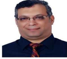
أ.د/ محمد الحسيني السبيعي شمس رئيس قسم الصيدلة الإكلينيكية والممارسة الصيدلانية