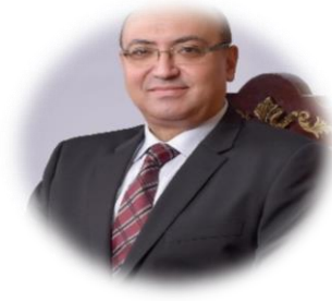
الأستاذ الدكتور / محمد عطيه البيومي نائب رئيس الجامعة لشئون التعليم والطلاب