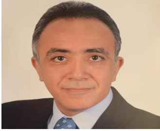
الأستاذ الدكتور/ أشرف طارق حافظ نائب رئيس الجامعة شئون الدراسات العليا والبحوث