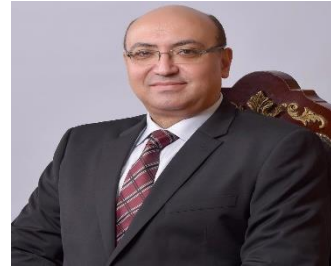
الأستاذ الدكتور/ محمد عطيه البيومي نائب رئيس الجامعة شئون التعليم والطلاب