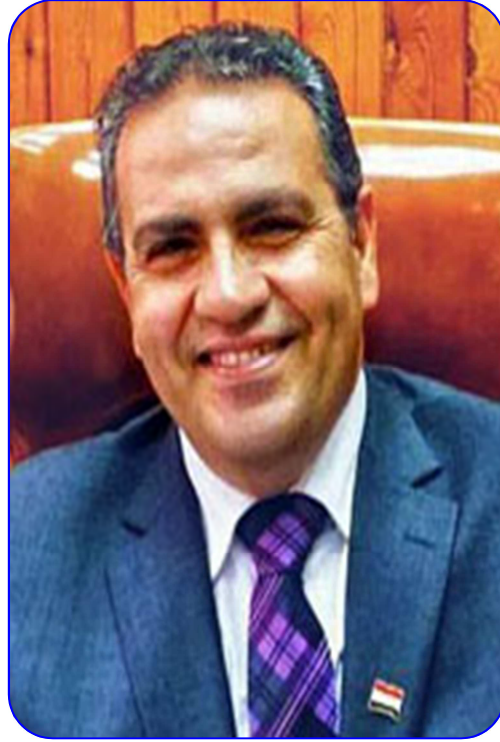
أ.د/ محمد حسن القناوي رئيس الجامعة