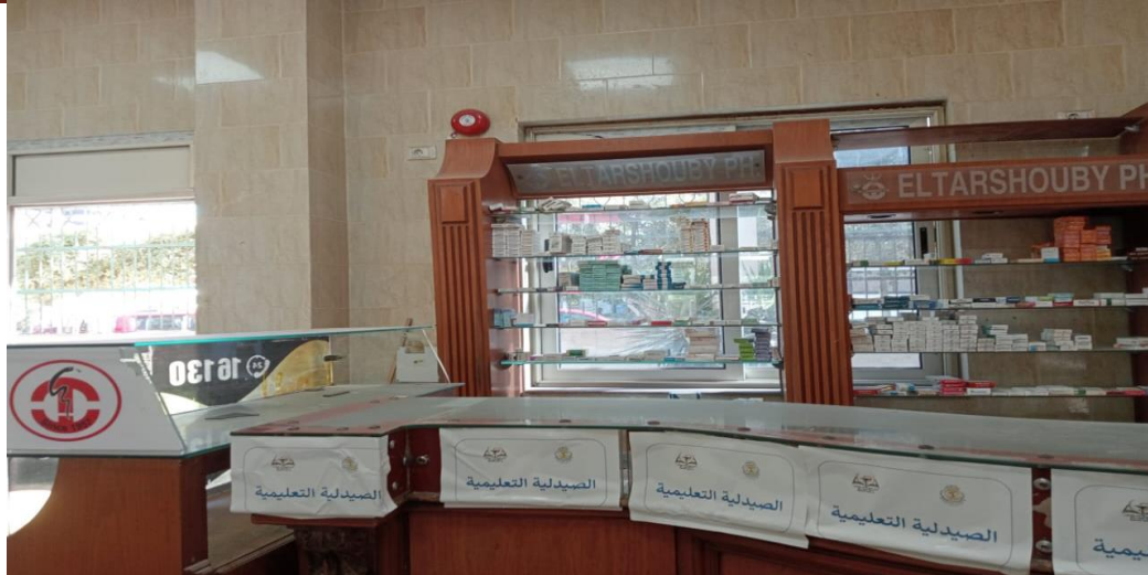
إعداد وتنسيق: أ / منى متولى حسن