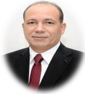
الأستاذ الدكتور / شريف يوسف حلمي خاطر رئيس الجامعة