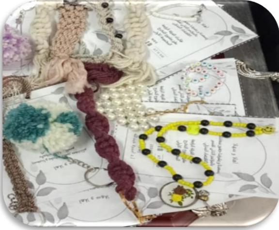
تجهيز الهدايا التذكارية