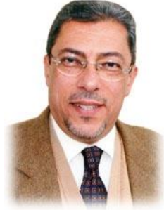
أ.د / أحمد بيومي شهاب الدين رئيس الجامعة