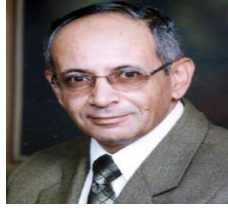
أ.د/ محمد كمال السمودى عميد الكلية