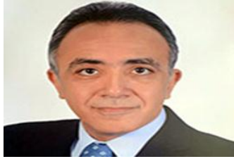
الأستاذ الدكتور/ أشرف طارق حافظ نائب رئيس الجامعة لشؤون الدراسات العليا والبحوث