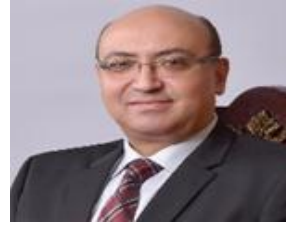
الأستاذ الدكتور/ محمد عطية البيومي نائب رئيس الجامعة لشؤون التعليم والطلاب